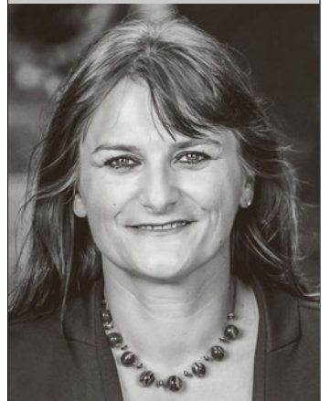
Christine Häslér Nationalrätin, Grindelwald

Heute haben wir – ohne Saisonierstatut – gleiche und ähnliche Schicksale wie damals. Versteckte Menschen, versteckte Kinder. Unsicherheit und Angst aber auch Ausbeutung. Kein gutes Klima. Auch nicht für uns als Gesellschaft. Wir wollen, dass Kinder in Würde und Sicherheit aufwachsen können. Und da zeigt sich; wir haben noch sehr viel zu tun!