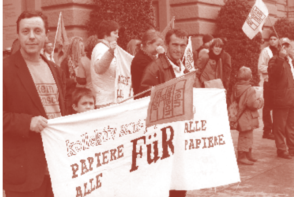
Aktion des Sans-Papiers-Kollektivs Bern vor dem Bundeshaus 2001